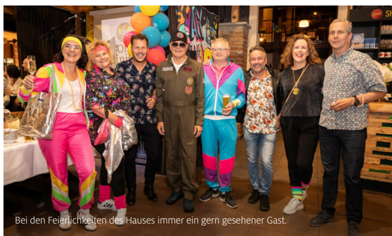
Bei den Feierlichkeiten des Hauses immer ein gern gesehener Gast.