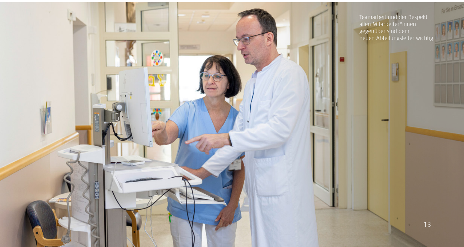
Teamarbeit und der Respekt allen Mitarbeiter*innen gegenüber sind dem neuen Abteilungsleiter wichtig.