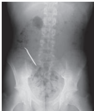
Abdomenübersicht mit Fremdkörper