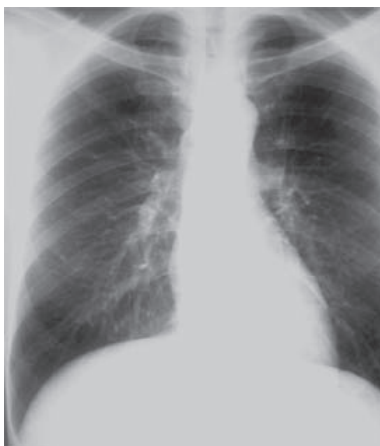
Thorax - Röntgen

Neben den Aufnahmen des Thorax - und Bauchraumes sowie des Skelettsystems