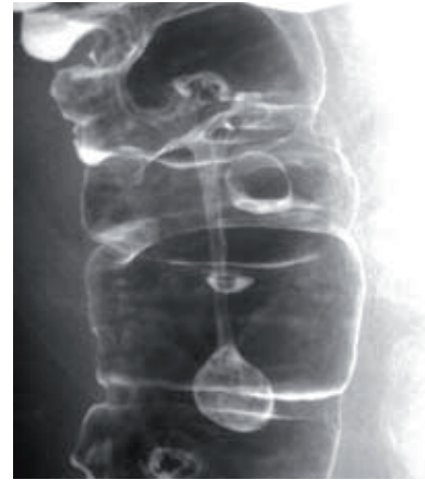
gestielter Polyp/ Divertikel

Daneben hat sich die funktionelle Diagnostik des Magen-Darmtraktes etabliert und stellt nun eine wichtige interdisziplinäre Diagnosemöglichkeit dar.